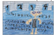
絵手紙部門 文部科学大臣賞