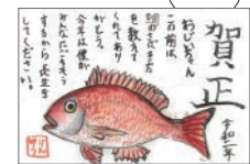
ことば部門 年賀状大賞

※発表段階では、内容に変更がある場合があります。詳細は、日本郵便株式会社のプレスリリースをご確認ください。