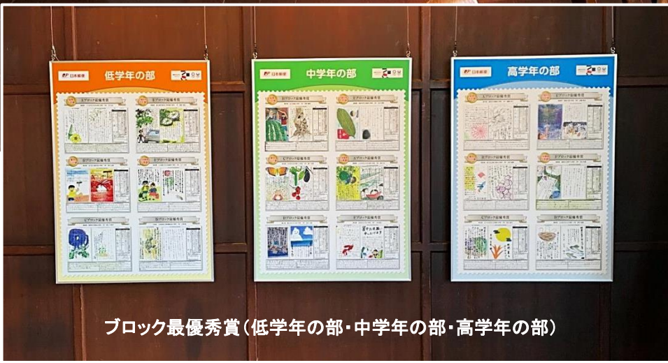
ブロック最優秀賞(低学年の部・中学年の部・高学年の部)

今年度のブロック最優秀賞に選ばれた計18作品を大会に先がけて展示中！ ぜひ、ご覧ください。(入場無料)